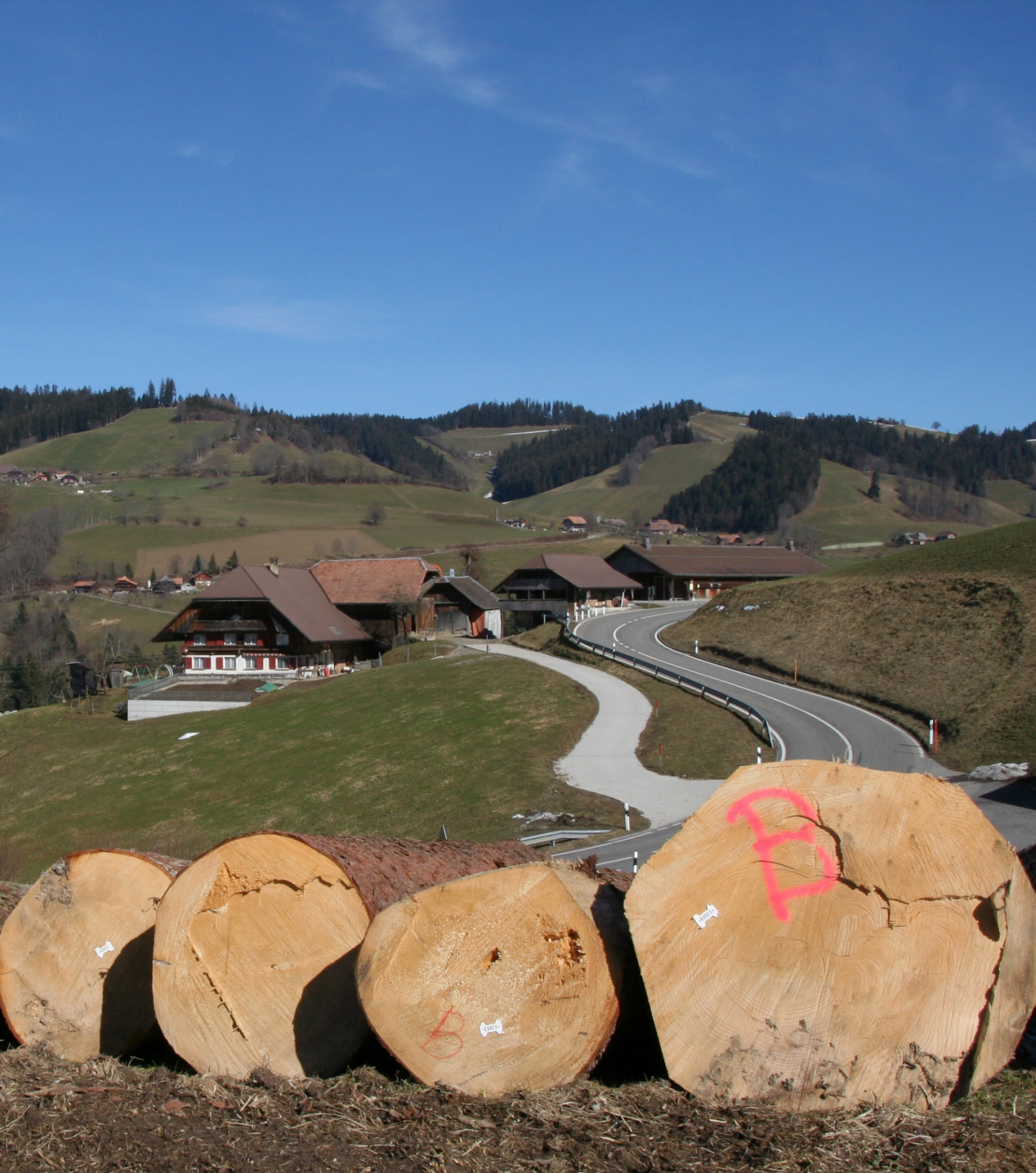
Aeschlen, Blick vom Hubel in Richtung Langenegg