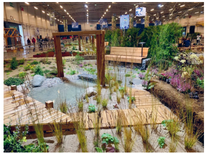
Das Gewinnerprojekt ist 40 m 2 gross.