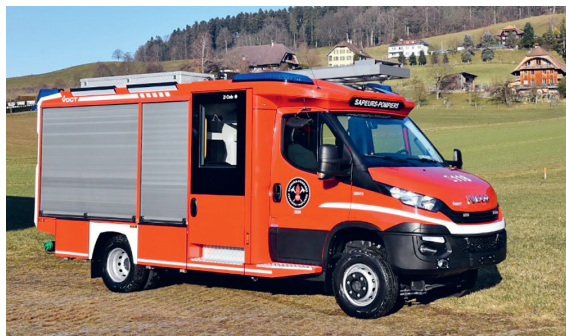
So könnte das neue Tanklöschfahrzeug aussehen

Das maximal 9 Tonnen schwere Tanklöschfahrzeug klein (TLFK) mit Allradantrieb und einer Besatzung von drei Personen soll auf dem Gemeindegebiet von Oberdiessbach, Oppligen und Herbligen eingesetzt werden. Es muss schwierig zugängliche und abgelegene Gebiete auf teilweise schmalen Strassen erreichen können und soll als Unterstützung bei grösseren Ereignissen dienen.