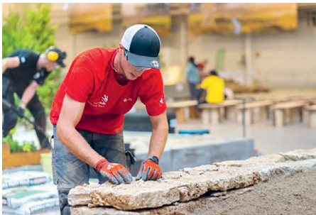
Volle Konzentration während des Wettbewerbs.